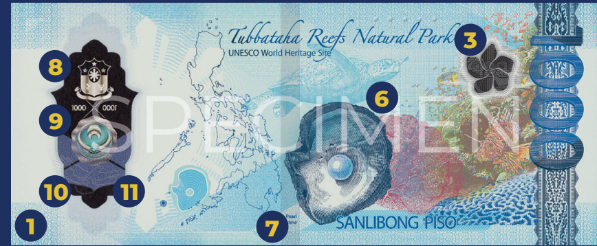
Disenyo sa likod: Tubbataha Reefs Natural Park (UNESCO World Heritage Site), South Sea Pearl ( Pinctada maxima ), at T'nalak weave design