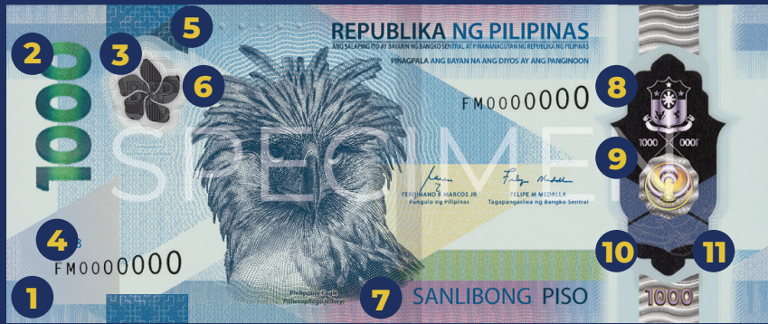
Disenyo sa harap: Philippine Eagle ( Pithecophaga jefferyi ) at Sampaguita ( Jasminum sambac )